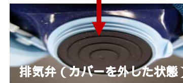
排気弁(カバーを外した状態)