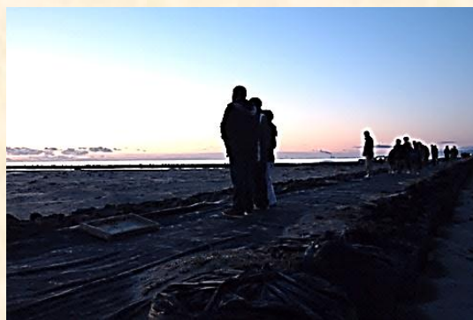
亙理町荒浜の初日