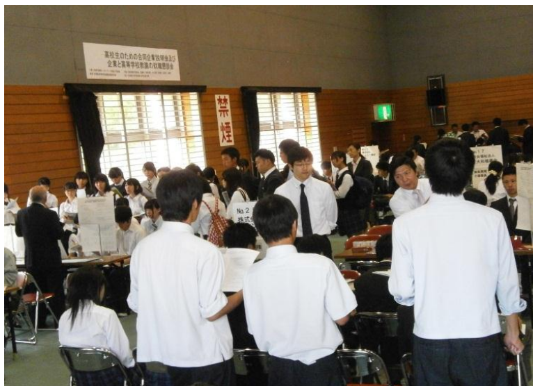
企業から説明を聞く高校生

生徒と企業の説明会では、企業から就職希望の生徒に対し具体的な事業内容や職場環境の説明がおこなわれました。