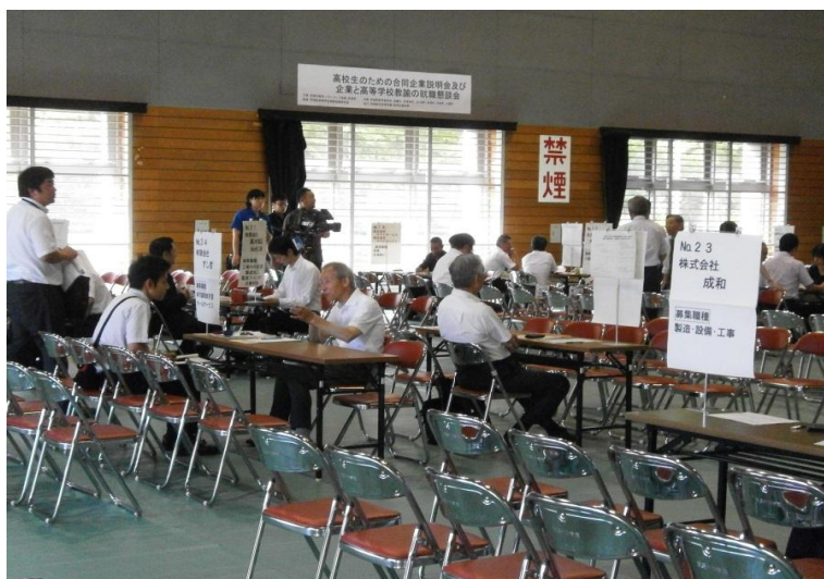
企業と高等学校教諭の懇談

テレビ局3社、NHK、東日本放送、仙台放送からの取材があり、高校生の就職後3年以内の離職率の高さに焦点を当てた取材をおこなっていました。